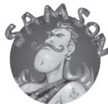
L'homme à la force surnaturelle