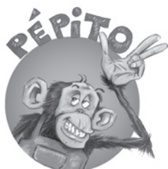
Le plus rusé des singes