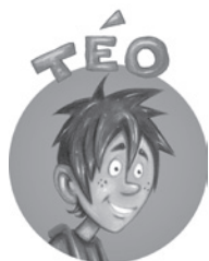
Le jeune héros rigolo