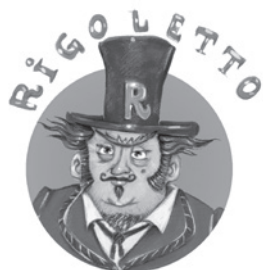
Le directeur au cœur tendre