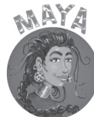
La belle échassière