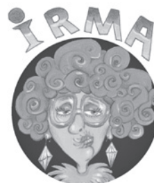
La mystérieuse spaghettinologue